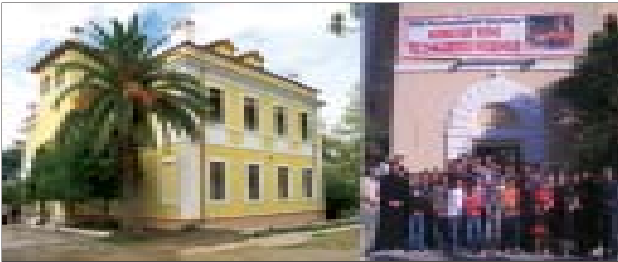
Godina e re e shkollës në Sukth të Durrësit, dhe një kujtim nga dita e parë e mësimit.