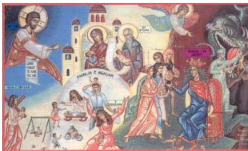
Ikona e Abortit

mijë." Mendoni pak në qoftë se nëna e Shën Vasilit të Madh do të kishte menduar si një grua, ku baza e së cilës është planifikimi familjar, atëherë nuk do të kishim Shën Vasil të Madh. Shumë vepra nuk do të shkruheshin dhe Kisha nuk do të kishte një kolos të madh.