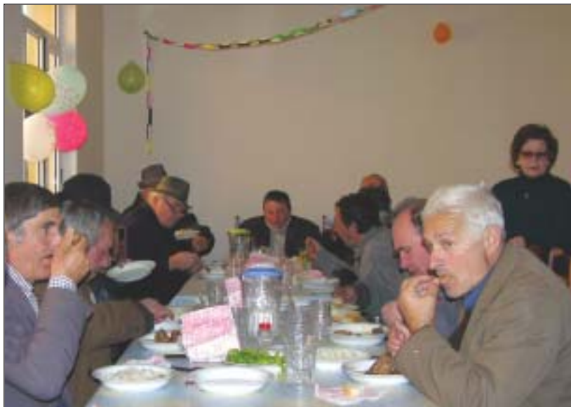
Pamje e mensës

Për momentin, në mensë po trajtohen rreth 30 persona, të cilët ushqehen me një meny të pasur