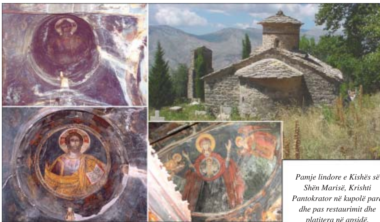
Pamje lindore e Kishës së Shën Marisë, Krishti Pantokrator në kupolë para dhe pas restaurimit dhe platitera në apsidë.