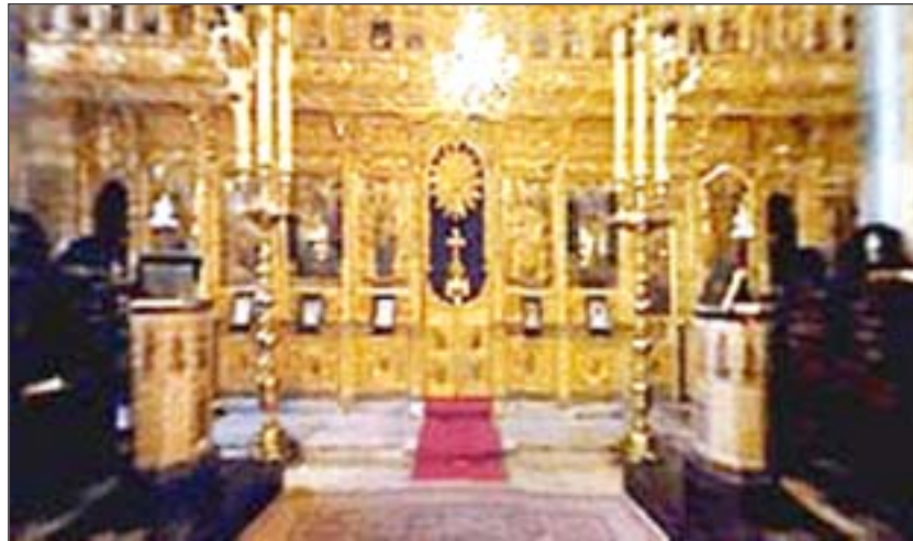
Pamje nga Kisha Patriarkale e Shën Gjergjit dhe nga salla e pritjeve të Patrikanës Ekumenike