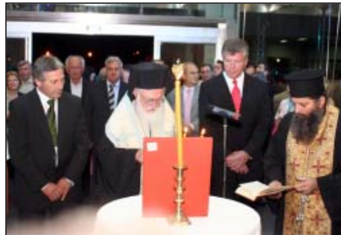
Gjithmonë e më shpesh bizneset, të mëdha apo të vogla, e nisin veprimtarinë e tyre duke kërkuar së pari bekimin e Perëndisë. Në fotot: Kryepiskopi Anastas gjatë ajzmës për përrurimin e filialit të BMW-së në vendin tonë.