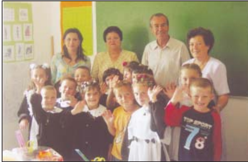
Foto nga dita e parë e mësimi.

Shkolla, me sistemin e ri 9-vjeçar, me një staf tme kualifikim të lartë, do përdorë metoda bashkëkohore dhe të tilla do këtë edhe pajisjet dhe mjediset. Sivjet filloi mësimi me një klasë të parë dhe në foto paraqiten çaste nga dita e parë e saj.