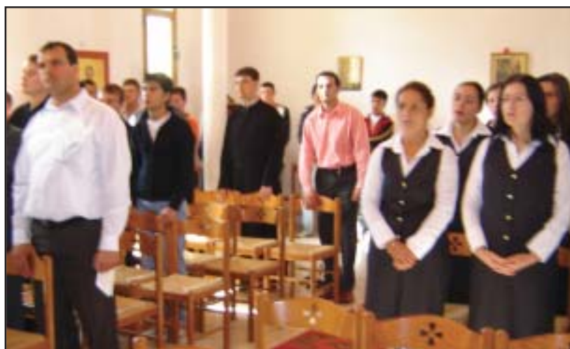
Në fotot: Çast nga shërbesa e ajazmës në kishën e Akademisë Teologjike "Ngjallja e Krishtit"