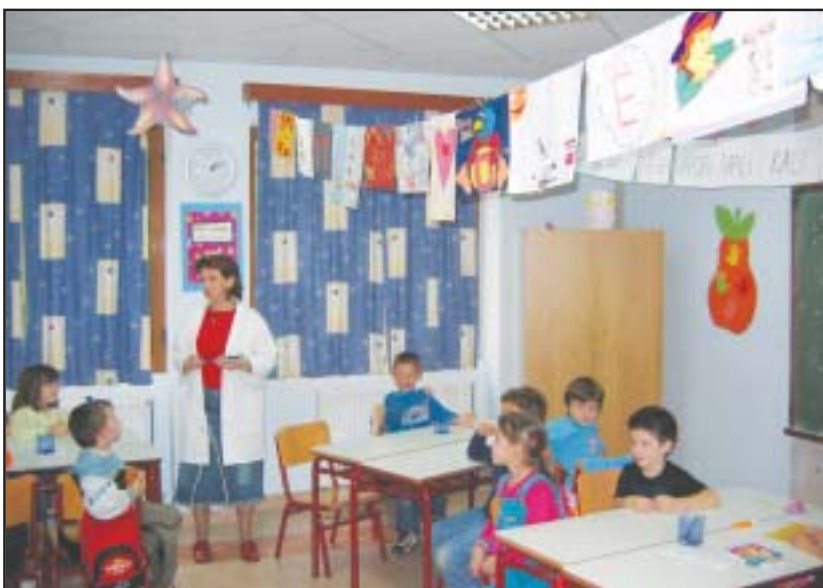
Foto nga dita e parë e mësimi.