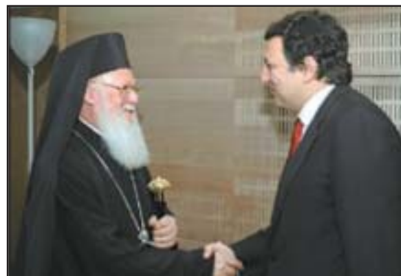
Patriku Ekumenik Vartholomeu I me Kryetarin e BE Barroso

Ndërsa u çelën negociatat midis Bashkimit Evropian dhe Turqisë, Patrikana Ekumenike denoncon presionet administrative mbi të. Kështu, Patriku Ekumenik ka protestuar energjikisht për faktin që prona të Kishës Orthodhokse janë regjistruar si “prona shtetërore”. Rasti i fundit i këtillë ishte ai i regjistrimit si prona shtetërore të manastireve orthodhokse të arqipelagut të Princërve, në detin Marmara. Ndërkohë, nuk duhet harruar se në skenën ndërkombe, Patriku Ekumenik Vartholomeu I ka mbështetur me vendosmëri pranimin e Turqisë në BE.