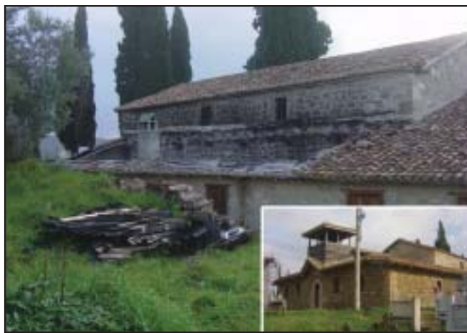
Pamje e pjesës së dëmtuar nga zjarri në kishën e Shë Kollit, Vanaj

Më 28.12.2003 është konstatuar se krahu verior i hajatit është djegur. Fatmirësisht zjarri nuk është përhapur në ambientet ngjitur të naosit dhe të narteksit për shkak të mureve ndarës që e kanë izoluar atë. Shkaqet e zjarrit ende nuk dihen, por ai ka djegur trarë, petavra, dritare dhe dyer, duke e lënë pjesën veriore të hajatit ku është edhe pagëzimetorja të hapur kundrejt agjentëve atmosferikë dhe të papërdorshme.