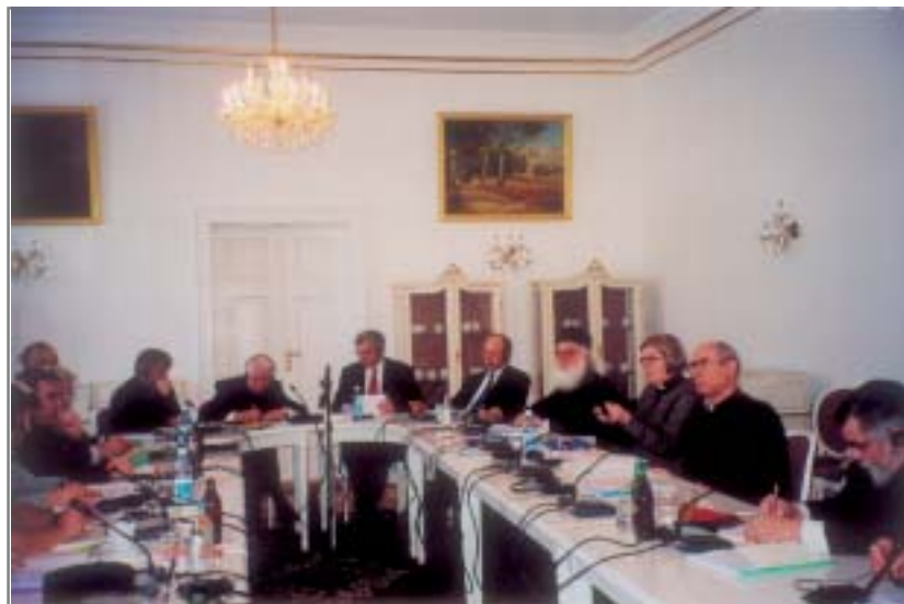
Çast nga takimi në Opole

“Ne si të krishterë, nëse do t'i hedhim një vështrim historisë, do të shohim se Kisha ka një karakter apostolik. Gjithashtu, ne kuptojmë se do ndjejmë një gëzim të madh