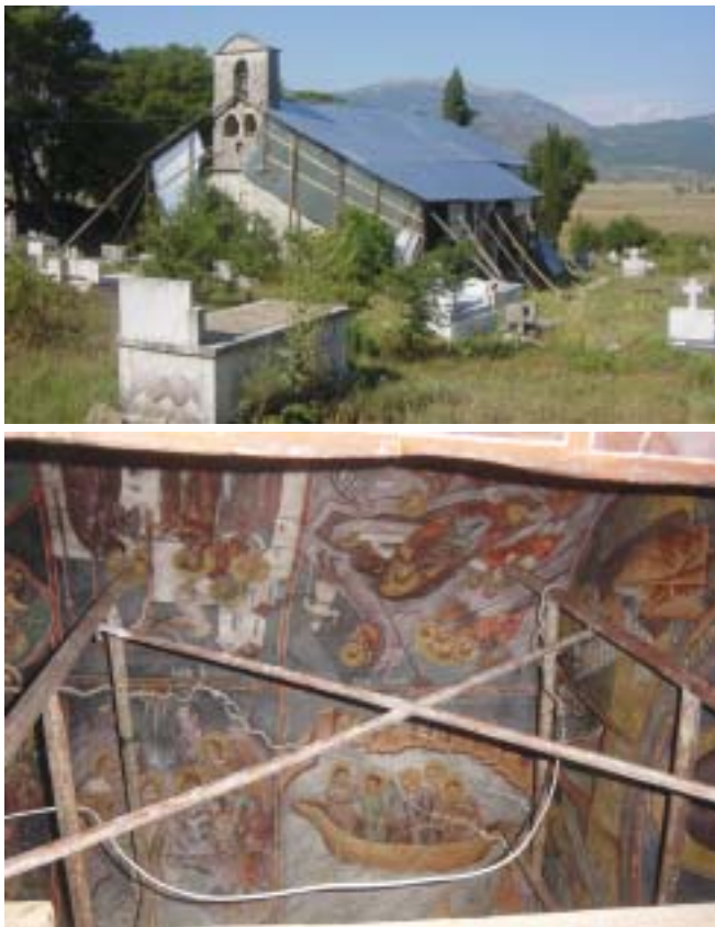
Pamje e jashtme dhe e brendshme e Kishës gjatë punimeve