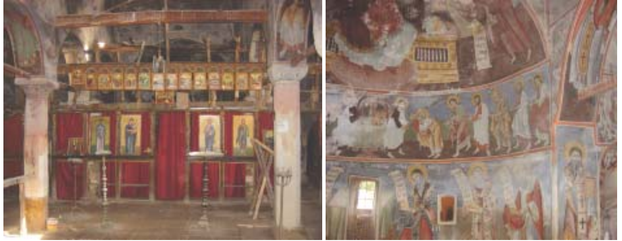
Pamje e ikonostasit, shumë pjesë të të cilit janë vjedhur dhe djathtas afreske të hierores

Vidhen pjesë të ikonostasit në kishën e fshatit Karavasta, në Lushnjë