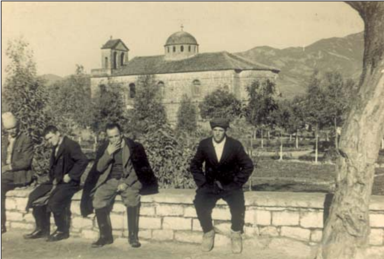
botohet për herë të parë